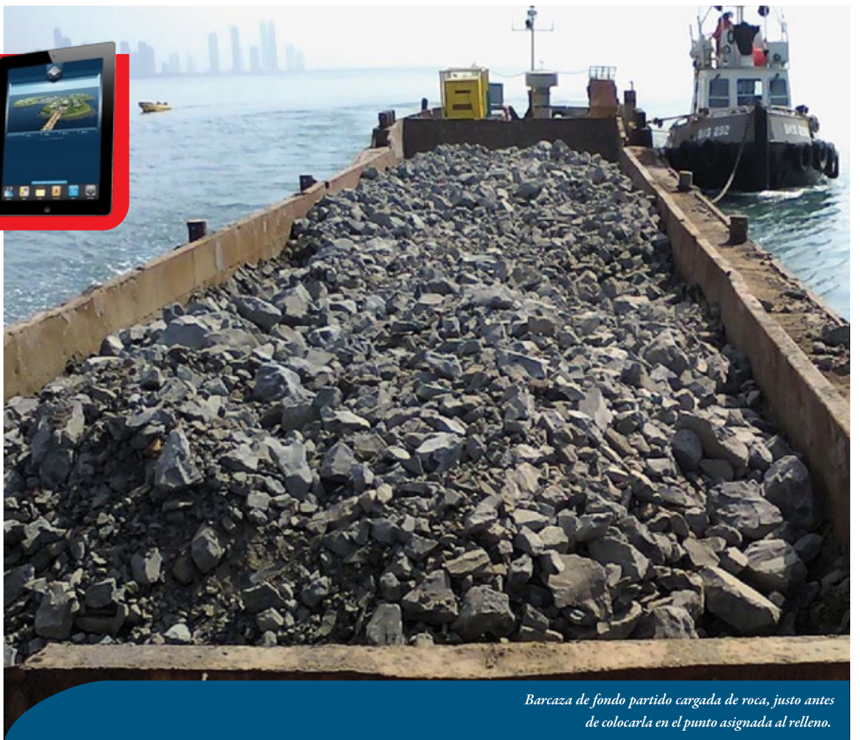
Barcaza de fondo partido cargada de roca, justo antes de colocarla en el punto asignada al relleno.