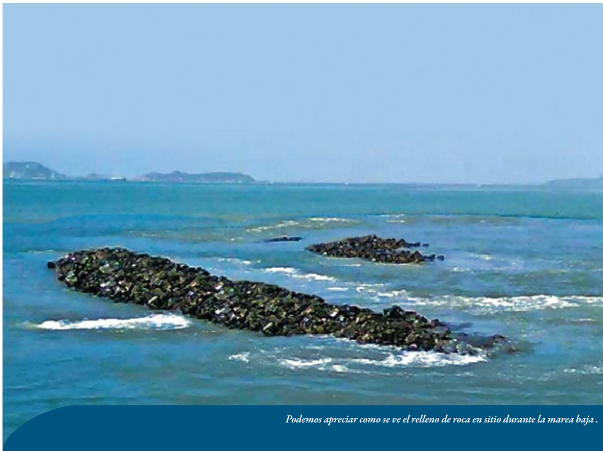
Podemos apreciar como se ve el relleno de roca en sitio durante la marea baja.

Inicia la etapa visible. Cada día lo intangible se convierte en una realidad. Continuamos con la construcción y la colocación de roca en sitio teniendo ya resultados visibles.