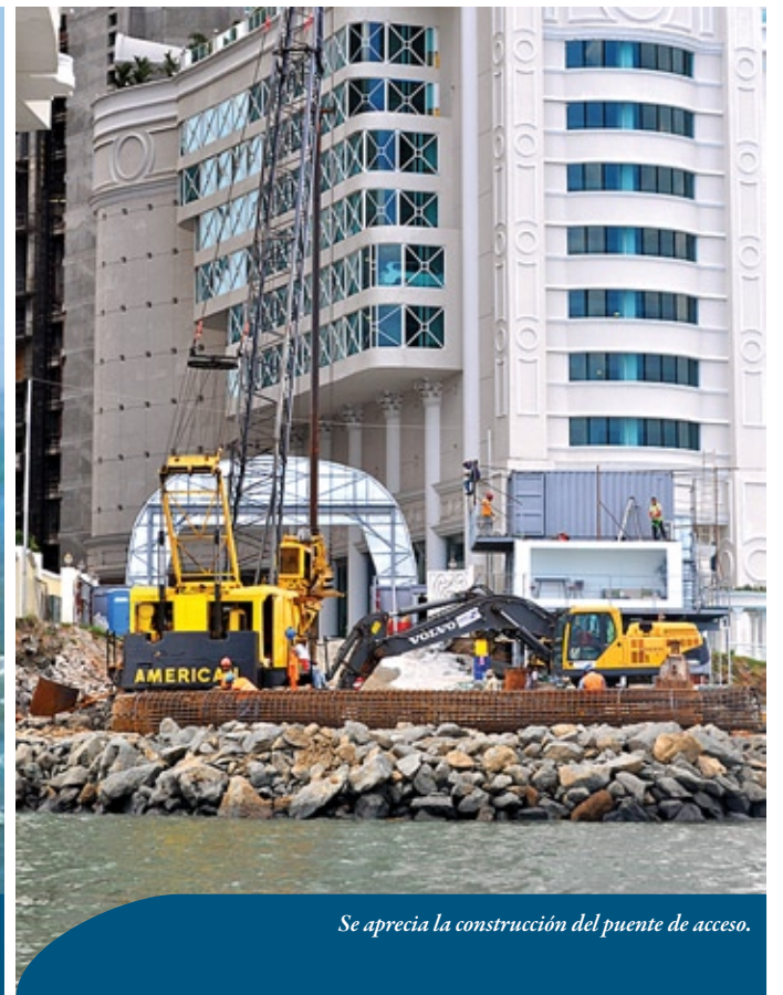
Se aprecia la construcción del puente de acceso.

Ya puede acceder nuestro website desde su iPad visitando: www.oceanreefislands.com/avances/ y ver EN VIVO el progreso de la construcción de las primeras islas construidas por el hombre en Latinoamérica.